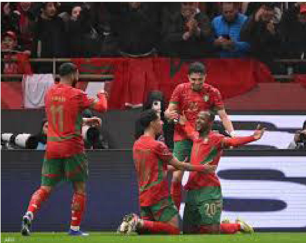
• المغرب يتعادل مع مالي

اكتفى المنتخب المغربي بنتيجة التعادل الإيجابي «1-1» أمام نظيره المالي، في المباراة التي جمعتهم على أرضية ملعب مولاي عبد الله بالرباط، ضمن منافسات الجولة الثانية من دور المجموعات لبطولة كأس الأمم الأفريقية 2025، المقامة بالمغرب والمتواصلة إلى غاية 18 يناير المقبل. وجاءت بداية التسجيل من جانب «أسود الأطلس» عبر نجم ريال مدريد الإسباني إبراهيم دياز، الذي نجح في تحويل ركلة جزاء إلى هدف عند الدقيقة الخامسة من الوقت بدل الضائع للشوط الأول، مانحاً أصحاب الأرض أفضلية معنوية قبل الاستراحة.