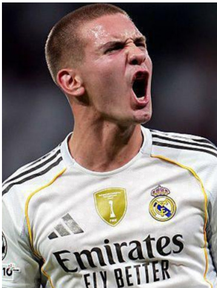
• الأرجنتيني ماستاتونو

تماماً مثل البرازيلي الشاب، حيث حقق شهرة عالمية واسعة عام 2025. وحقق لاعب ريفر بلت السابق قفزة نوعية، باتضمامه إلى ريال مدريد، حيث منحه تشابي ألونسو مكاناً أساسياً في التشكيلة. وخاض اللاعب المهارى الأعسر، الذي يتمتع بحس عال في قراءة مجريات اللعب، أول مباراة له مع المنتخب الأرجنتيني الأول في يونيو، لكن مسيرته توقفت أخيراً بسبب الإصابة. ريان شرقي وجد الفرنسي ريان شرقي إيقاعه مسيطراً في كل من الدوري الفرنسي والدوري الأوروبي، وهو ما كان كافياً ليقنع المدرب الإسباني ييب غوارديولا بالتعاقد معه. أما أصغر لاعب في هذه القائمة، فهو من ألمانيا، ومنذ ظهوره الأول مع بايرن ميونخ في فوز ساحق 10 - صفر على أوكلاند سيتي النيوزيلندي بكأس العالم للأندية، أصبح لاعب خط الوسط الهجومي لينارت كارل وجهاً مألوفاً في تشكيلة فريقه.