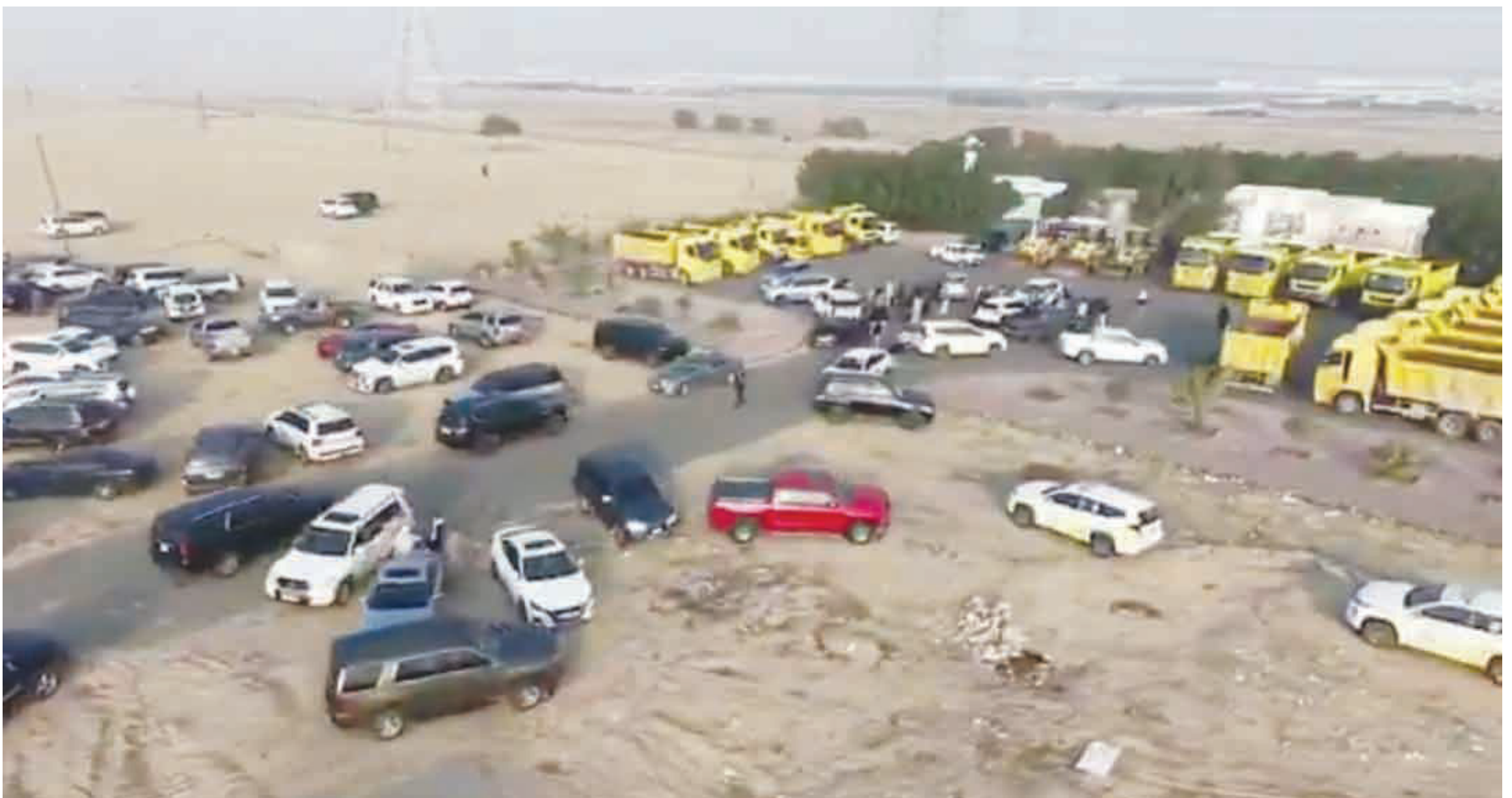
• رجال الأمن أثناء تنفيذ الحملة الميدانية في كبد

• ضبط أعداد كبيرة من العمالة السائبة والهاربين من أحكام قضائية والمطلوبين الداخلية... التصدي بكل حزم لأي مخالفات أو تجاوزات تمس الأمن العام