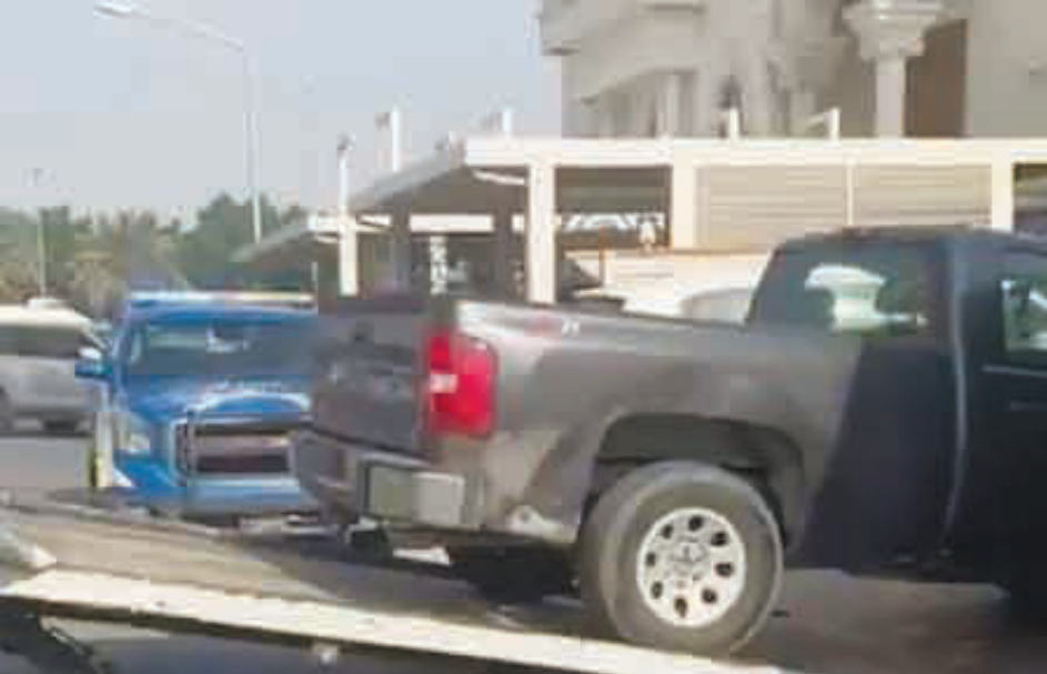
• أثناء ضبط السيارة

حققت الطائرات الكهربائية ذات الإقلاع والهبوط العمودي بدون طيار خطوة غير مسبوقة، بعدما أكملت طائرة الجيل السادس من طراز eVTOL التابعة لشركة بوينغ ويسك أيرمو رحلتها التجريبية