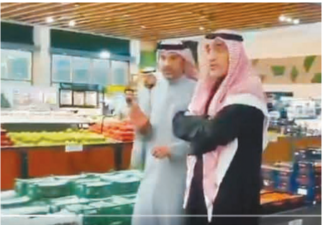
• الشيخ فهد اليوسف أثناء جولته في مواقع اتحاد المزارعين المخصصة لبيع الخضار والفواكه

قام النائب الأول لرئيس مجلس الوزراء ووزير الداخلية الشيخ فهد اليوسف بجولة تفقدية مفاجئة شملت مواقع اتحاد المزارعين المخصصة لبيع الخضار والفواكه للمواطنين والمعمومة من الدولة في مناطق فهد الأحمد والأندلس والجهراء، وذلك في إطار المتابعة الميدانية المباشرة لسير العمل وضمان الالتزام بالأنظمة واللوائح المعمدة. ووجه اليوسف باتخاذ الإجراءات اللازمة لتمكين المزارعين من بيع منتجاتهم مباشرة للمواطنين من خلال هذه المواقع وبالألية المناسبة، بما يحقق الهدف الأساسي من إنشائها. ويسهم في تخفيض أسعار الخضار والفواكه، ويعود بالنفع المباشر على المواطنين. وتهدف الجولة إلى الوقوف على ك마من الخلل، وضبط أي ممارسات غير مشروعة السابقة، والتأكد من إزالة جميع أوجه التجاوز، بما يضمن تحقيق العدالة في العرض والأسعار، ومنع أي تدخلات. وتأتي هذه الجولة في أعقاب ما تم رصده من مخالفات جسيمة وشبهات تجاوزات إدارية ومالية، تمثلت في تلقي مبالغ مالية «رشوة» من بعض الشركات التجارية مقابل تمرير منتجاتها ومنحها أولوية داخل الجمعيات، في مخالفة صريحة للأنظمة والقوانين المنظمة لألية الدعم وتكافؤ الفرص. ووجه اليوسف باتخاذ إجراءات حازمة وفورية بحق كل من ثبت تورطه في أي ممارسات مخالفة، مؤكدا عدم التهاون مع أي تجاوز يمس المال العام أو يخل بمنظومة الدعم، مع إحالة المخالفات إلى الجهات المختصة لاتخاذ الإجراءات القانونية اللازمة. وأكد اليوسف أن هذه الجولات الميدانية تأتي