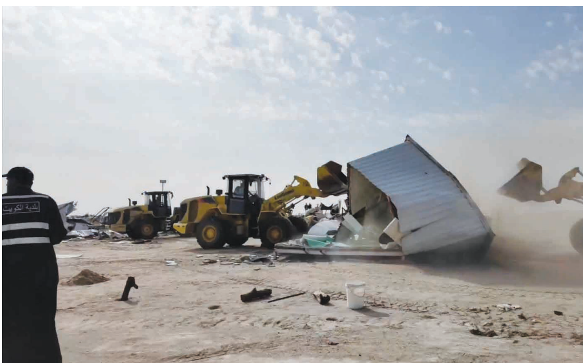
• إزالة التعديات

وأكدت وزارة الداخلية استمرارها في تنفيذ الحملات الأمنية المشتركة بشكل متواصل ودوري بالتعاون مع الجهات المعنية، ومواصلة التصدي بكل حزم لأي مخالفات أو تجاوزات تمس الأمن والنظام العام، مع اتخاذ أقصى الإجراءات القانونية بحق المخالفين دون تهاون.