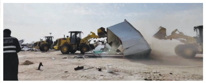
• جانب من الحملة الميدانية الموسعة في كبد... وفي الإطار إزالة التعديات

في إطار نهج واضح لترسيخ مبادئ النزاهة والشفافية، وتعزيز الرقابة الميدانية، والتصدي بكل حزم لأي محاولات للإضرار بالصلحة العامة أو استغلال الدعم المقدم للمواطنين. وأشار النائب الأول لرئيس مجلس الوزراء ووزير الداخلية إلى أن الهدف الأساسي من هذه الإجراءات هو حماية المستهلك وضمان وصول المنتجات بأسعار عادلة، والحفاظ على منظومة الدعم بما يخدم المواطن ويحقق الاستقرار في الأسواق»