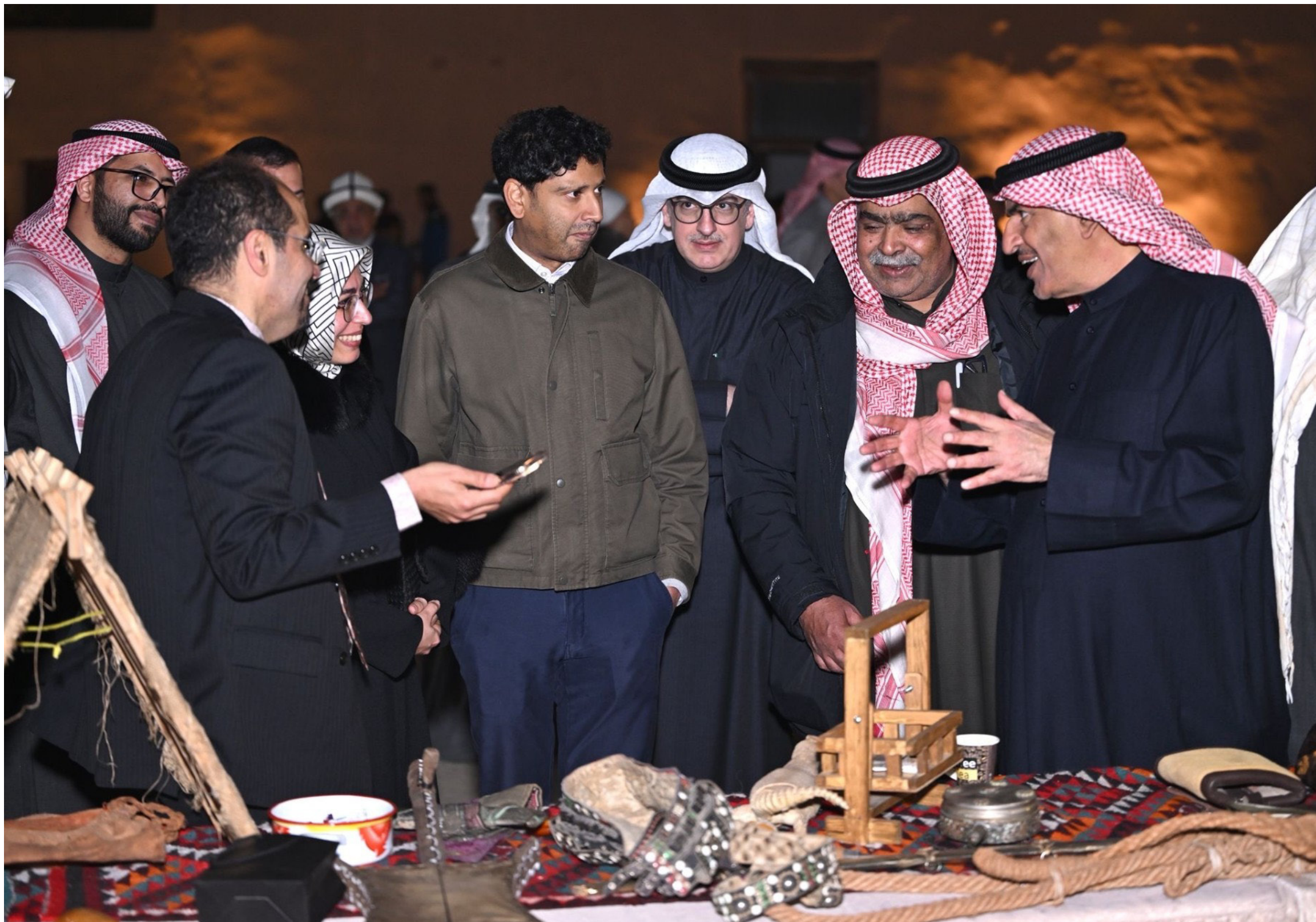
• محافظ الجهراء في المعرض التراثي