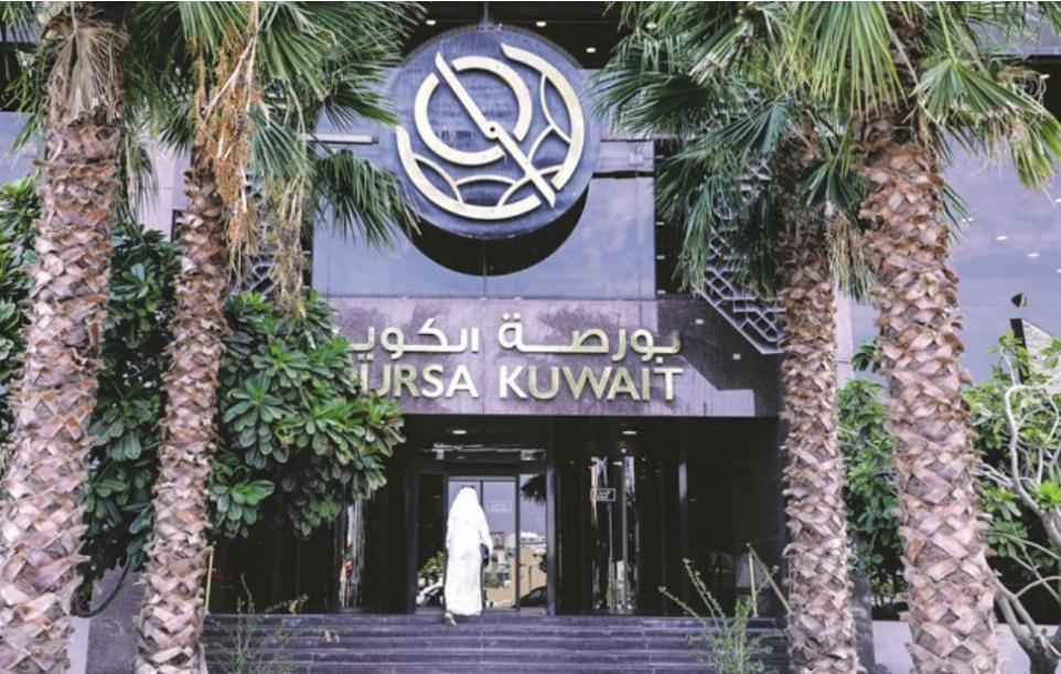
• بورصة الكويت