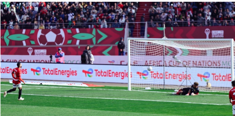
• الفراعنة يتأهلون