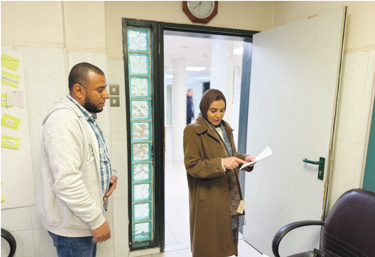
• وزيرة الشؤون أثناء زيارة مركز الإيواء

أعلنت وزارة الداخلية ممثلة بالإدارة العامة لنظم المعلومات وبالتنسيق مع الإدارة العامة لشؤون الإقامة عن اطلاق خدمتين إلكترونيتين جديدتين عبر موقعها الرسمي وذلك في إطار جهودها المتواصلة لتطوير الخدمات الرقمية وتسهيل الإجراءات. وقالت «الداخلية» في بيان ان الخدمات الجديدة تشمل «خدمة إصدار إقامة لأول مرة لعمالة القطاع الأهلي