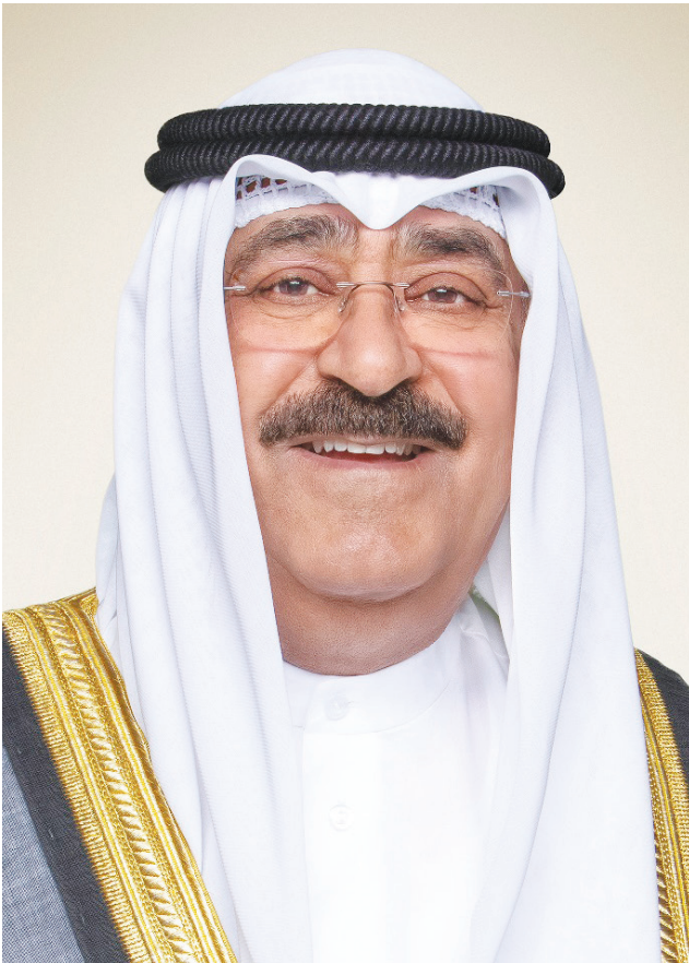
• صاحب السمو أمير البلاد

بعث سمو ولي العهد الشيخ صباح الخالد ببرقية تهنئة إلى دولة الدكتور محمد يونس المنفي - رئيس المجلس الرئاسي الليبي في دولة ليبيا الشقيقة. ضمنها سموه خالص تهانیه بمناسبة الذكرى الرابعة والسبعين لعيد الاستقلال لبلاده وراجيا له وافر الصحة والعافية ولدولة ليبيا وشعبها الشقيق المزيد من التطور والنماء.