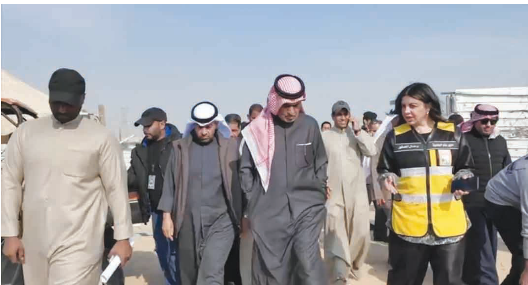
• مديرة البلدية شاركت في الحملة

كتب محسن الهيلم: شنت السلطات الأمنية حملة مشتركة مع البلدية على التعديات على أملاك الدولة في منطقة كبد وقامت بإزالة التعديات بشكل فوري.