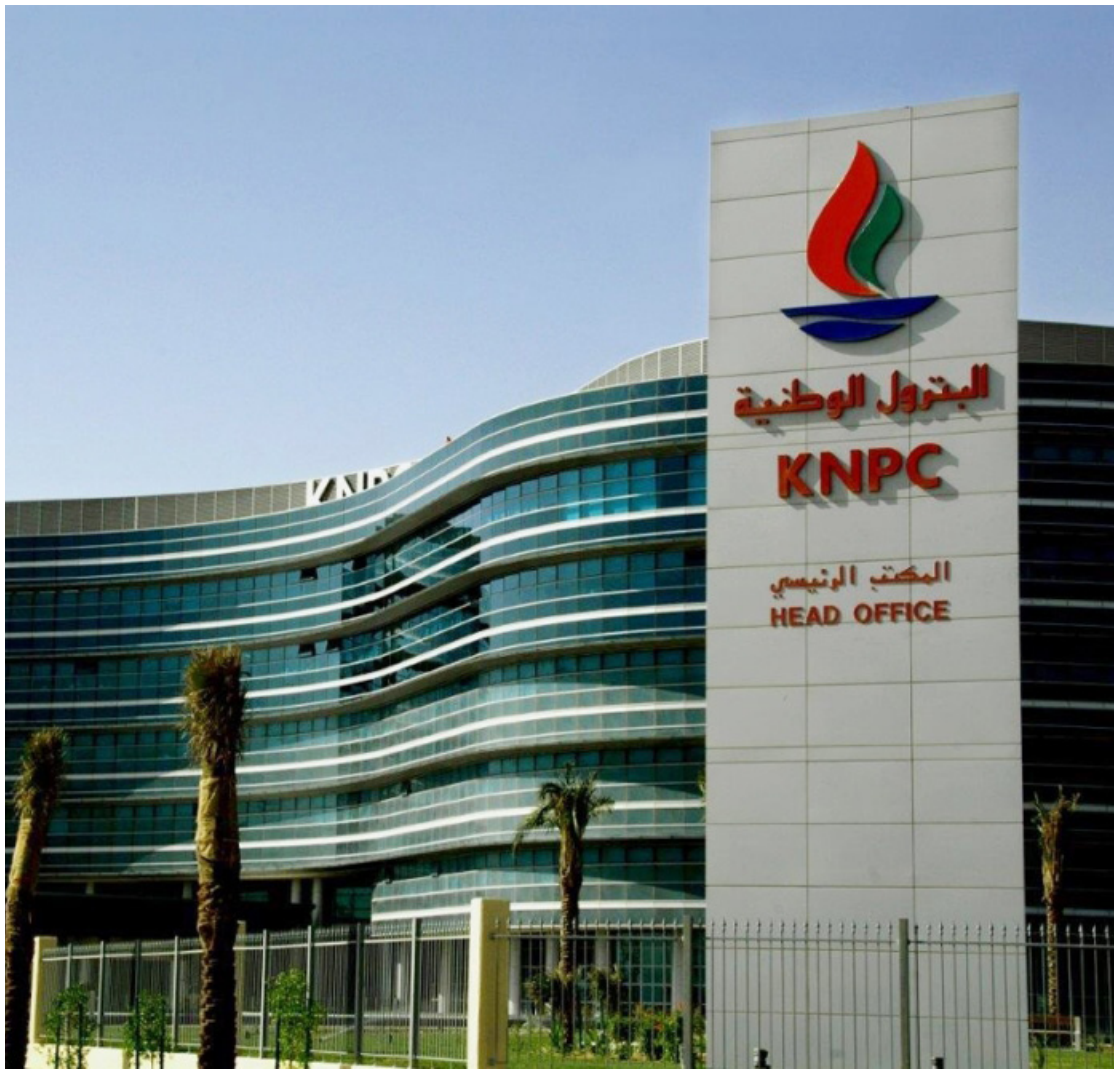
• شركة البترول الوطنية

وشملت عملية الدمج نقل العاملين والأصول والعمليات لتصبح جميعها مملوكة ومدارة بالكامل من قبل شركة البترول الوطنية الكويتية ومع انضمام مصفاة الزور التابعة لـ «كبيك» ذات الطاقة التكريرية البالغة 615 ألف برميل يوميا سترتفع الطاقة التكريرية لـ «البتترول الوطنية» إلى 1ر415 مليون برميل يوميا ما يضع دولة الكويت في موقع تنافسي متقدم عالمياً في قطاع التكرير. ويهدف الدمج إلى توحيد الجهود لمواجهة تحديات صناعة التكرير وتعزيز الالتزام تجاه العملاء وتحسين الكفاءة والاعتمادية ودعم التميز التشغيلي. وتمتلك «البتترول الوطنية» الشركة الكويتية لتزويد الطائرات بالوقود «كافكو» حيث تتولى الشركة حصرياً تزويد جميع الطائرات بالوقود في مطار الكويت الدولي إضافة إلى تقديم الاستشارات والدعم الفني لوزارة الدفاع.