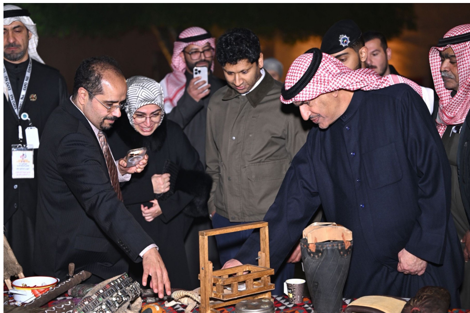
• في القصر الأحمر