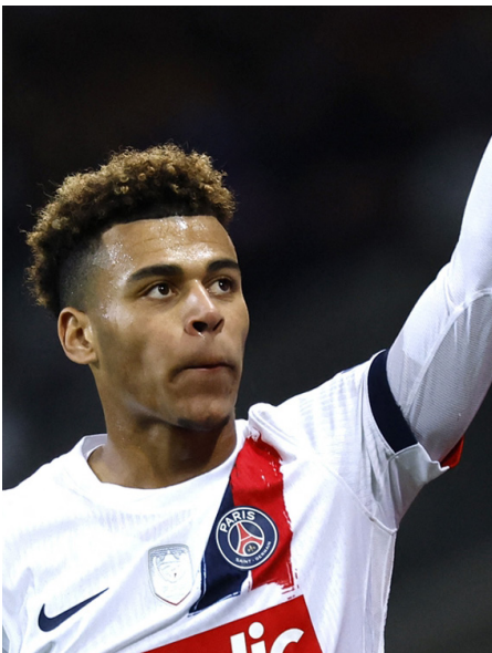
• الفرنسي ديزيري دويه