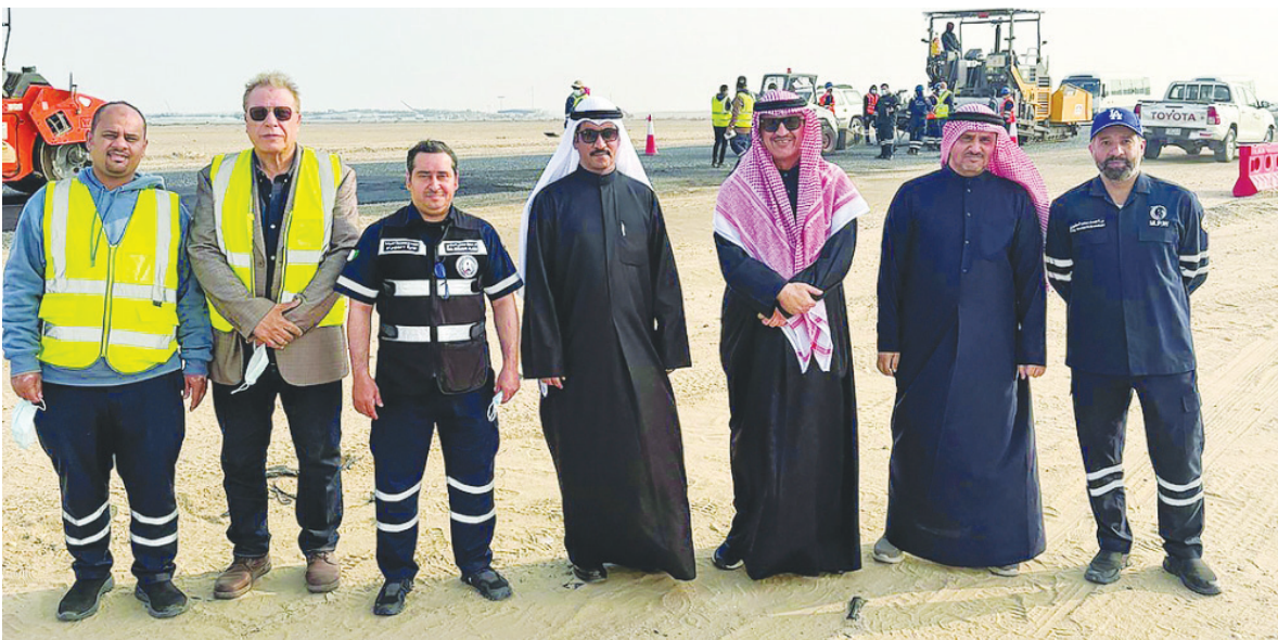
• محافظ الجھراء ووكيل الأشغال أثناء الجولة

أكدت وزيرة الشؤون الاجتماعية وشؤون الأسرة والطفولة الدكتورة أمثال الحويلة حرصها على تلمس احتياجات ذوي الإعاقة والاطمئنان على مستوى الرعاية المقدمة لهم. جاء ذلك بتصريح صحافي خلال زيارة ميدانية مفاجئة قامت بها