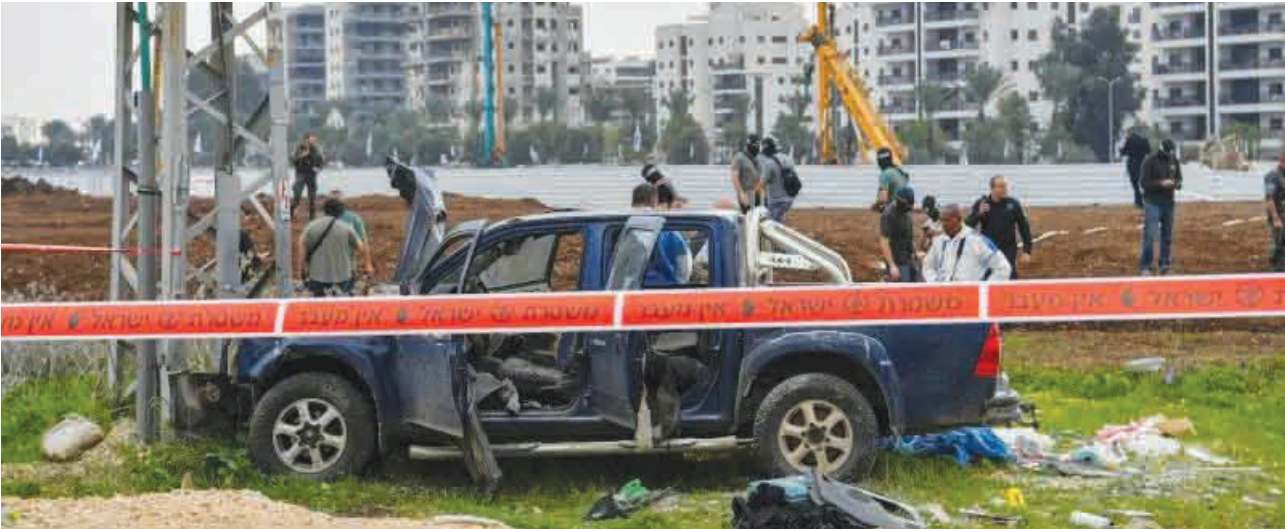
• تجمع أممي صهيوني في مواقع العملية

وقالت مصادر إن منفذ العملية شاب فلسطيني، دهس إسرائيلي، ثم ترجل من سيارته وطعن امرأة، مشيرة إلى أنه أصيب برصاص الشرطة الإسرائيلية التي تمكنت من اعتقاله.