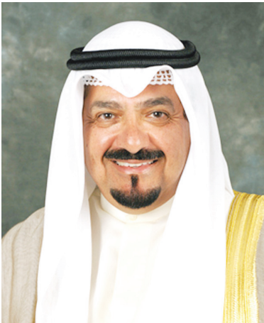
• سمو الشيخ أحمد العبدالله

بعث سمو الشيخ أحمد العبدالله رئيس مجلس الوزراء ببرقية تهنئة إلى دولة الدكتور محمد يونس المنفي - رئيس المجلس الرئاسي الليبي في دولة ليبيا الشقيقة بمناسبة الذكرى الرابعة والسبعين لعيد الاستقلال لبلاده.