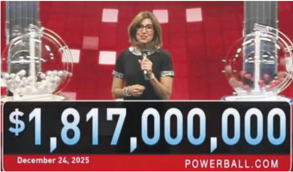
• أثناء السحب على جائزة «باوربول» لليانصيب في أميركا عشية عيد الميلاد

على الإطلاق وأكبر جائزة باوربول هذا العام»، وحملت التذكرة الفائزة في السحب الذي جرك عشية عيد الميلاد أمس الأربعاء، الأرقام: 4 25 و31 و52 و59، إضافة إلى رقم «باوربول» 19.