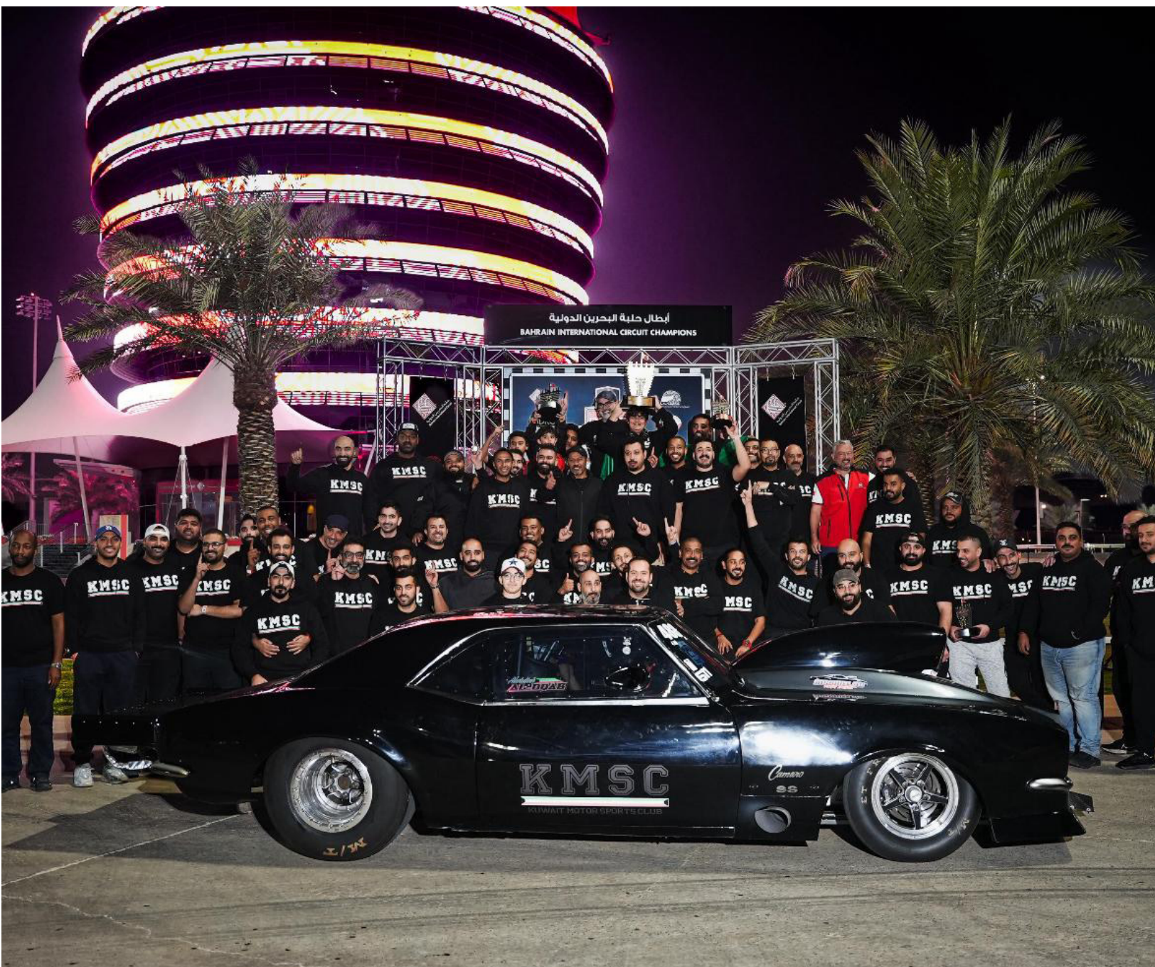
• المشاركون في البطولة