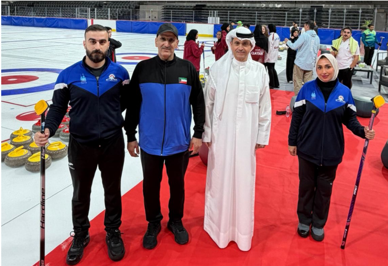
• مشاركة كويتية