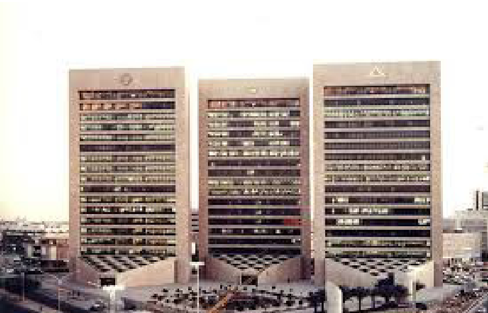
• بنك كويتية

وعند المقارنة ما بين أداء البنوك، حقق بيت التمويل الكويتي أعلى مستوى أرباح بين البنوك التسعة ببلوغها نحو7.492 مليون دينار كويتي «ربحية السهم 27.98 فلس»، أو نحو 37.8٪ من صافي أرباح القطاع المصرفي، بنمو بنحو 2.0٪ مقارنة مع الفترة ذاتها من عام 2024. وحقق بنك الكويت الوطني ثاني أعلى أرباح بنحو 467.4 مليون دينار كويتي «ربحية السهم 51 فلس» أو نحو 35.8٪ من صافي أرباح البنوك ونسبة نمو بنحو 2.3٪ بالمقارنة مع الفترة نفسها من العام السابق. وبذلك، استحوذ بنكان «بيتك والوطني» على 73.6٪ من إجمالي أرباح البنوك، ما يرجع أن اقتصاديات الحجم في العمل المصرفي لصالح الكيانات المصرفية الكبرى. ذلك يعني أن المصارف السبعة الأخرى تشاركت في نحو 26.4٪ من أرباح القطاع، أعلى نسبة مشاركة كانت للبنك التجاري الكويتي بنحو 6.9٪. وادنى نسبة مشاركة كانت لبنك الكويت الدولي وينجو 1.6٪. وحقق بنك وربة أعلى ارتفاعا نسبيا في مستوى الأرباح وينجو 158.6٪، بينما حقق بنك الخليج أكبر انخفاضا نسبيا بنحو 4.6٪.