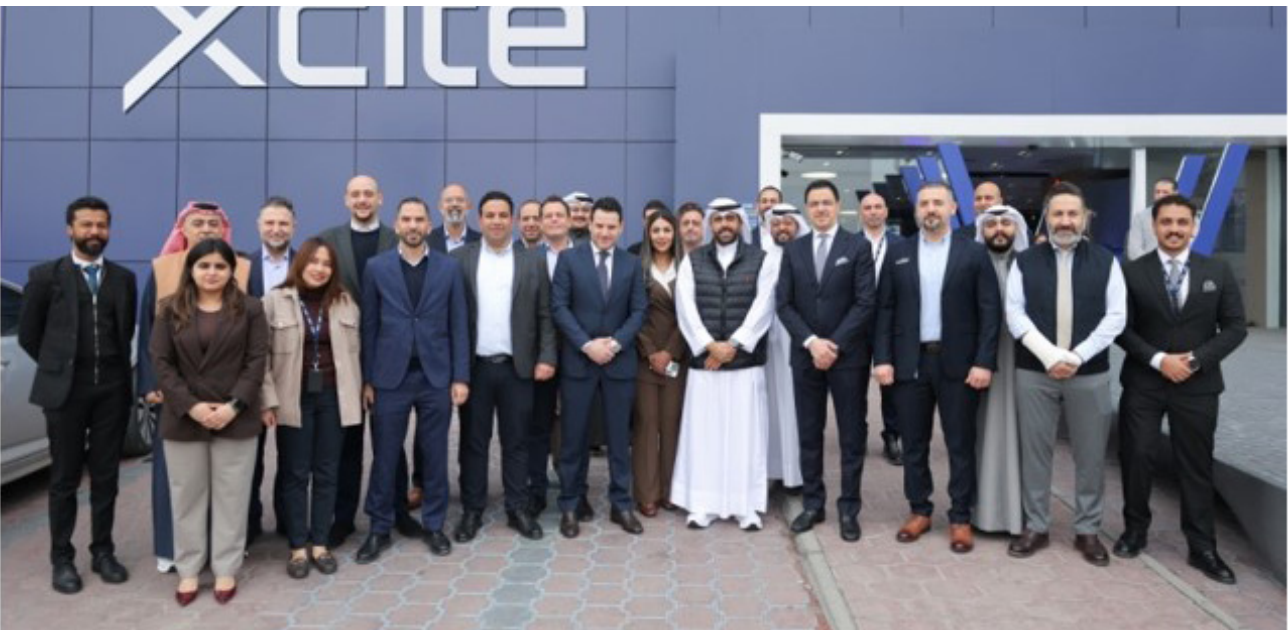
• موظفو المركز في الجهراء

تخطط حكومة رئيسة الوزراء في اليابان، ساتاي تاكايوشي، للإعلان عن ميزانية أولية قياسية للسنة المالية التي تبدأ في أبريل المقبل، مع زيادة الإنفاق بوتيرة أسرع من معدل التضخم الأسائد. وأوضحت تاكايوشي ، أن ميزانية بلغ 2026 ستيبلغ نحو 122.3 تريليون ين، ما يعادل 786 مليار دولار، وهو ما يمثل زيادة بنسبة 6.3 بالمئة عن ميزانية العام الحالي لتصبح الأضخم في تاريخ البلاد.تعتزم الحكومة اليابانية جمع نحو 29.6 تريليون ين عبر إصدار سندات حكومية جديدة لتمويل هذا الإنفاق الضخم، مع العمل على خفض نسبة اعتماد الميزانية على الدين.وقالت تاكايوشي إن نسبة الاعتماد على إصدار الدين ستخفض إلى 24.2 بالمئة مقابل 24.9 بالمئة في السنة المالية الحالية، مؤكدة أن الإنفاق الدفاعي ضمن الميزانية، وهو ما يعزز النمو الاقتصادي وحضان الاستدامة المالية للدولة.تأتي هذه الميزانية التاريخية في وقت ظل فيه مؤشر أسعار المستهلك في اليابان عند مستوى 2 بالمئة أو أعلى لأكثر من ثلاث سنوات، مما أذك لارتفاع تكاليف المعيشة وأعلى لأكثر من 39.1 تريليون ين وفقا لـ«بلومبرغ».أدك تصاعد التوترات الجيوسياسية إلى رفع احتياجات الإنفاق الدفاعي ضمن الميزانية، وهو ما يعكس رغبة حكومة تاكايوشي في استخدام الدعم المالي لتعزيز الأمن القومي والنمو الاقتصادي.وتتضمن الميزانية أيضا تكاليف متزايدة لخدمة الدين مع ارتفاع العوائد، حيث تخطط وزارة المالية لتحديد معدل فائدة مؤقت عند 3 بالمئة، وهو المستوى الأعلى الذي تسجله البلاد منذ عام 1997.