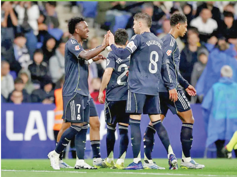
• ريال مدريد... يتقدم

ومع تبقي أربع مباريات على نهاية الموسم، يتصدر برشلونة الترتيب برصيد 88 نقطة، بفارق 11 نقطة عن ريال مدريد صاحب المركز الثاني، قبل مواجهة الفريقين في المركز الثاني، قبل مواجهة الفريقين في كامب نو مطلع الأسبوع المقبل في مباراة القمة التي قد تؤكد فوز الفريق الكتالوني باللقب للموسم الثاني على التوالي