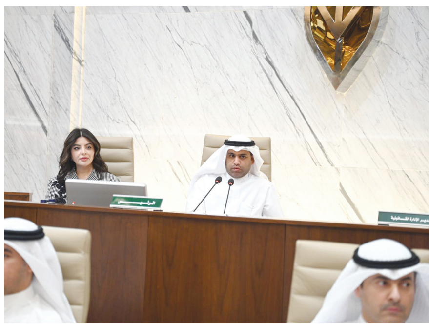
• جانب من الجلسة

وافق المجلس البلدي في جلسته الرئيسية أمس برئاسة عيادته المحري على اشتراطات ومواصفات أبنية المستشفيات الخاصة في مختلف المناطق. واعتمد البلدي الجدول الخاص الذي ينظم آلية أبنية العيادات والمستشفيات الخاصة إذ تم تحديد النسب التجارية لأبنية المستشفيات الخاصة على أن لا تتعدى نسبة 6 في المئة من مساحة القسيمة. وحدد المجلس ثمانية أنشطة يمكن استغلالها في تلك المستشفيات الخاصة وهي صيدلية ونظارات طبية ومحل زهور ومحل هدايا وملابس أطفال وكافتيريا ومحل حلويات وبيع بالتجزئة. ووافق على اشتراط البلدية في بناء المستشفيات الخاصة والتقيد بتطبيق الكود الكويتي للتصميم العام المعتمد من الهيئة العامة لشؤون ذوي الإعاقة. كما وافق المجلس على طلب تخصيص موقع لصالح هيئة تشجيع الاستثمار المباشر لتنفيذ مشروع الخدمات اللوجستية وبناء مستودعات متطورة للأمن الغذائي في جنوب الشداية بمساحة 250 ألف متر مربع تنفيذاً لقرار مجلس الوزراء. ووافق على طلب وزارة الصحة بإعادة تخصيص مبنى معسكر شباب الصليبية والأراضي التابعة والمخصصة سابقاً للهيئة العامة للشباب لتسقله «الصحّة» كمنشأة صحية لمعالجة مرضى الإدمان. ورفض ترميم مهلة سنة تعديل أوضاع أبراج الاتصالات مع بعض التعديلات على جدول اشتراطات أبراج الاتصالات ضمن لائحة البناء.