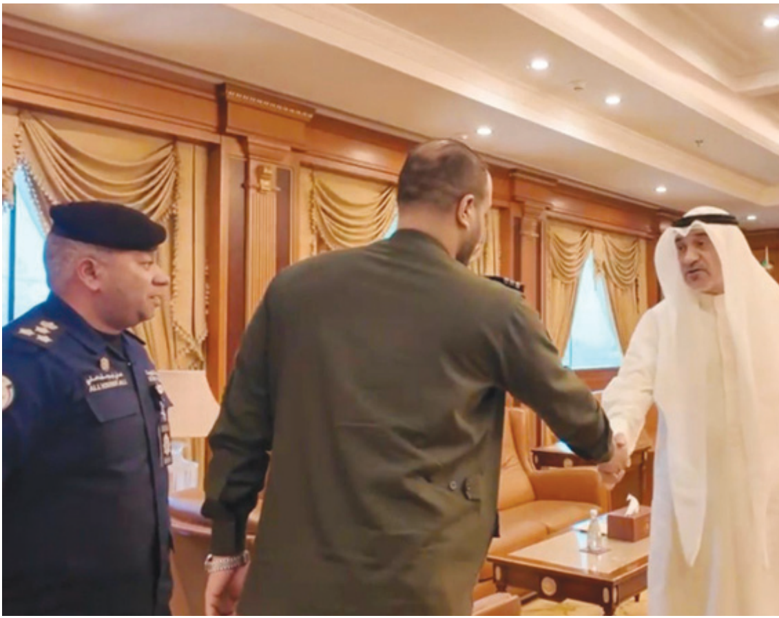
• جانب من الاستقبال

• التدقيق والبصمة البيومترية كشفت أنه مسجل باسم آخر ويحمل جوازاً أجنبياً • تمت إحالة المتهم إلى جهات الاختصاص لاتخاذ الإجراءات القانونية اللازمة بحقه