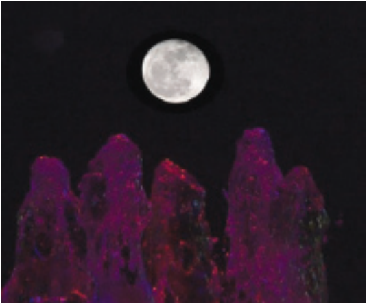
... في سماء الكويت

أضواء القمر سماء الكويت وبدد عتمة الليل بمنظر جميل يبعث على الهدوء والراحة. كان المشهد بسيطا ولافتا بلا نجوم تشغل النظر. فقط «قمر» واضح يملأ السماء وينعكس نوره على مرآة البحر.