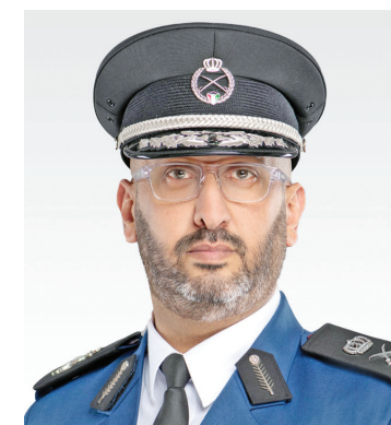
• اللواء طلال الرومي

الكفاءة والاحتراف. وجدد التحية لـ«هذا العطاء» وأكد ضرورة الاستمرار في رفع مستوى الجاهزية العملية والتمسك بأعلى معايير الانضباط والسلامة والعمل بروح الفريق الواحد لتنفيذ المهام بكل دقة وإتقان.