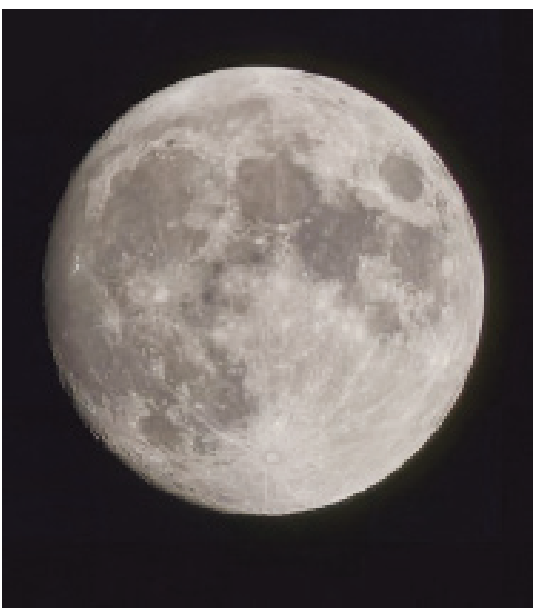
«قمر» واضح يملأ السماء

أضواء القمر سماء الكويت وبدد عتمة الليل بمنظر جميل يبعث على الهدوء والراحة. كان المشهد بسيطا ولافتا بلا نجوم تشغل النظر. فقط «قمر» واضح يملأ السماء وينعكس نوره على مرآة البحر.