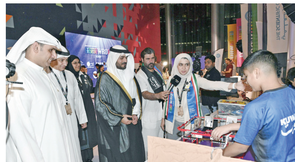
• جانب من المشاركين في المسابقة

العلمي عمق هذه الشراكة الراحسة، وتفخر بما تحقق معاً في تطوير العقول وتعزيز مكانة الكويت على الساحة العالمية. ويشترك في البطولة 8 فرق، وتتنافس ضمن بيئة تحاكي أجواء البطولات الرسمية، بهدف رفع مستوى الجاهزية الفنية وتعزيز الخبرات العملية لدى الطلبة المشاركين وتأتي هذه البطولة ضمن جهود إعداد وتأهيل الفرق من الكويت للمشاركة في نهائيات البطولة العالمية للروبوتات (World Robot Olympiad)، حيث سيتم اعتماد نتائج الفرق المشاركة بشكل رسمي ضمن نظام WRO.