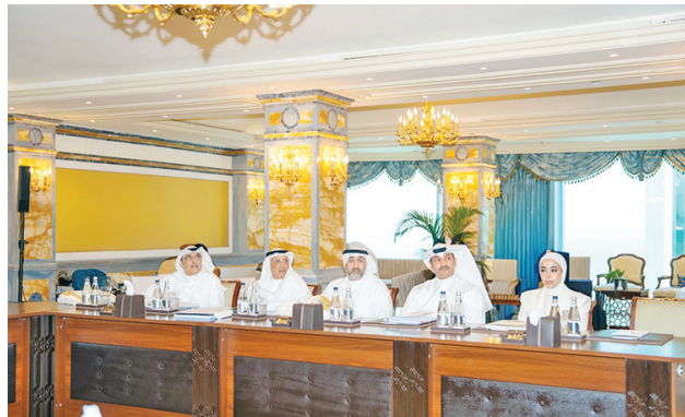
• جانب من وفد وزارة المالية المشارك في الاجتماع

الدور كشررك استراتيجي في مواجهة التحديات الاقتصادية ودعم مسارات التنمية المستدامة. وقد أسفرت الاجتماعات عن اعتماد عدد من القرارات، من أبرزها اعتماد تقارير مجالس الإدارة السنوية لعام 2025، وإقرار الحسابات الختامية للسنة المالية المنتهية في 31 ديسمبر 2025، اختيار رؤساء مجالس الإدارة ونوابهم من المحافظين، وتعيين المدققين الخارجيين لعام 2026. كما تمت الموافقة بالإجماع على مقترح الكويت باستقطاع 10% من صافي أرباح عام 2025 لدعم الشعب الفلسطيني، بما في ذلك دعم صندوق الأقصى ولجنة القدس الشريف، والموافقة على مقترح تعديل اتفاقية