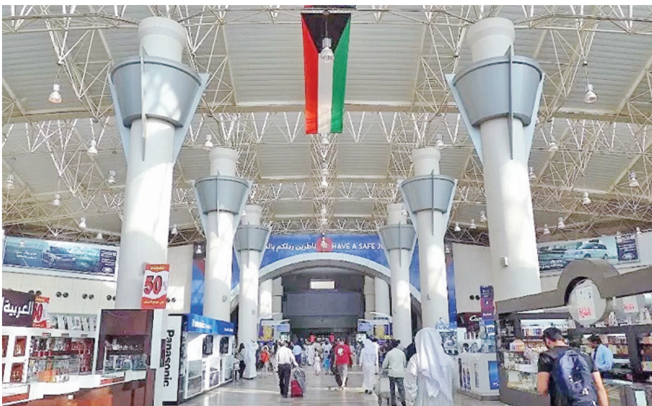
• مطار الكويت

وقال الشيخ حمود الصباح في تصريح آنذاك إن هذه الخطوة تأتي بالتنسيق مع الجهات المعنية والدولية المختصة لضمان عودة التشغيل وفق أعلى معايير السلامة والأمن ضمن خطة مرحلية مدروسة لاستئناف الحركة الجوية بشكل تدريجي تمهيدا للتشغيل الكامل للمطار خلال الفترة المقبلة. وشمل التشغيل في مرحلته الأولى محطات محددة وفق أولويات تشغيلية تضمن سلامة العمليات مع استمرار التقييم لكل مرحلة قبل الانتقال إلى مراحل أوسع وتشغيل الرحلات الجوية تدريجياً بداية من 26 أبريل الماضي برحلات من ميني الركب «تي 4» و«تي 5» لوجهات محددة.