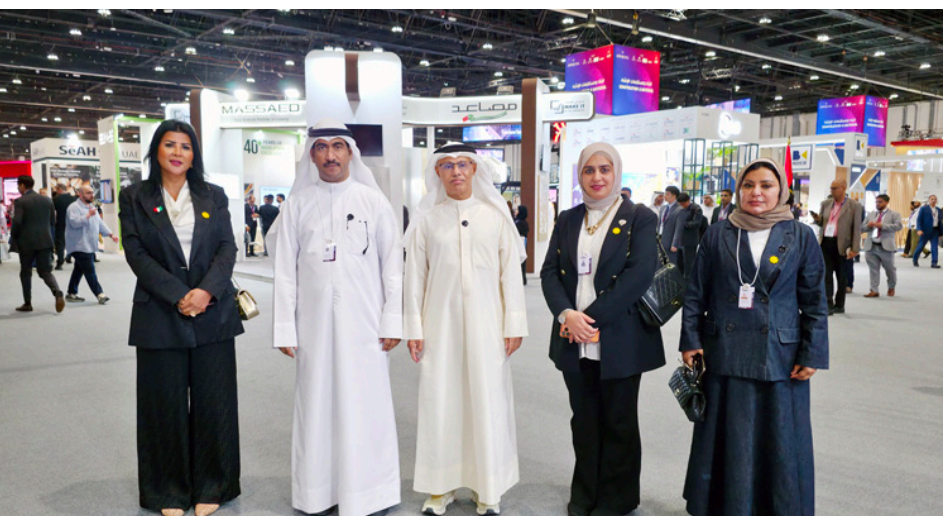
• وكيل وزارة الكهرباء والماء الدكتور عادل الزامل يتوسط وفد الكويت

في تنظيم هذا الحدث والذي أصبح منصة رائدة تجمع صناع القرار والخبراء والمستثمرين من مختلف أنحاء العالم. وأكد التزام وزارة الكهرباء والماء بتعزيز الشراكات الاستراتيجية وتوسيع مجالات التعاون مع مختلف الجهات الإقليمية والدولية بما يسهم في تطوير قطاع الطاقة ودعم الابتكار وتحقيق التنمية المستدامة. وتطلعاتها نحو مستقبل أكثر كفاءة واستدامة. وقد انطلقت فعاليات منصة «اصنع في الإمارات 2026» بنسختها الخامسة اليوم الإثنين في مركز أديك أبوظبي تحت شعار «الصناعة المتقدمة.. بنظرة أقوى». بمشاركة وزراء وقادة أعمال ومستثمرين وصناعيين ومبتكرين من المنطقة والعالم وتمثل مشاركة وفد الكويت في الفعالية بعدد من المسؤولين في قطاعات الأشغال والكهرباء والإسكان.