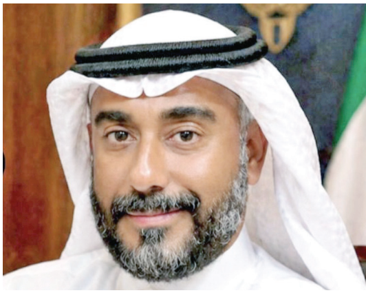
• حلال النمش

وافقت اللجنة الأولمبية الكويتية رسمياً على اعتذار الاتحاد الكويتي لكرة الطائرة عن مشاركة المنتخب الوطني في منافسات دورة الألعاب الخليجية الرابعة المقرر إقامتها في قطر خلال الفترة من 11 إلى 22 مايو الجاري.