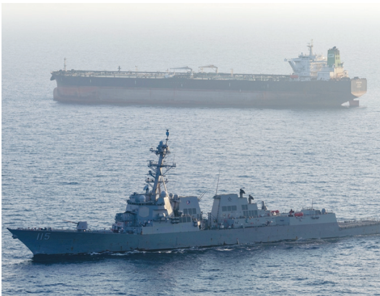
مضيق هرمز.. توتر ومواجهات

وذكرت وكالة الأنباء العمانية أمس أن مبنى سكني لموظفي إحدى الشركات بمنطقة (تيتان) بولاية «بخاء» تعرض لاستهداف أسفر عن إصابة متوسطة لشخصين. ونقلت الوكالة عن مصدر أمني القول إن الاستهداف أسفر أيضاً عن «تأثر أربع مركبات وزوج أحد المنازل المجاورة». وأضافت أن الجهات المختصة تقوم «بتقصي الحقائق» مؤكدة «حرصها على اتخاذ كافة الإجراءات لما فيه أمن وسلامة المواطنين والمقيمين». وقالت أميركا أنه لم تتعرض السفن البحرية الأميركية إلى أي هجمات إيرانية.