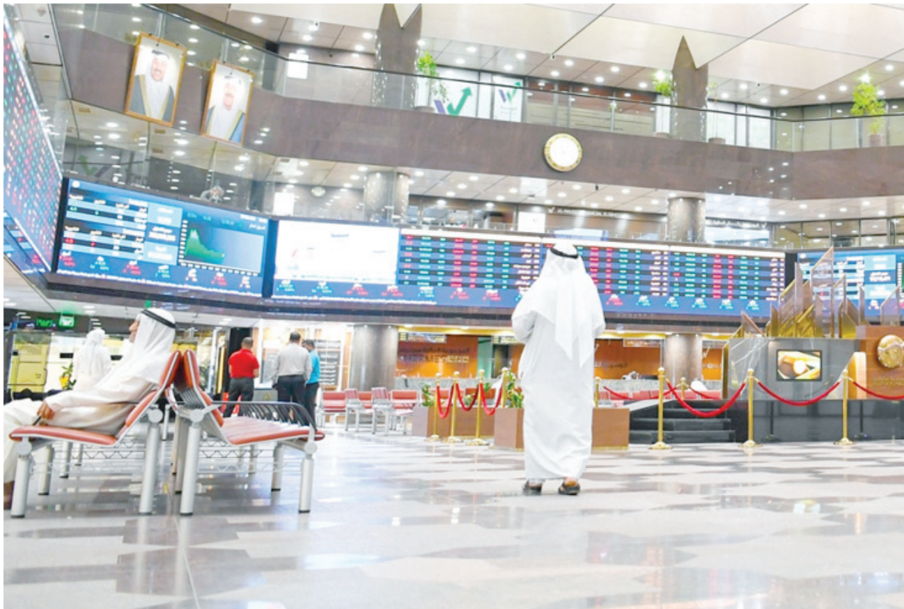
• بورصة الكويت

البيعي على كل من المؤسسات/ الشركات، والاستثمارية. وعلى الجانب الآخر، سجل الأفراد صافي تعامل شرائي في الأربعة أشهر الأولى من العام بقيمة 63.59 مليون دينار، ويتبعهم محافظ العملاء بـ2.17 مليون دينار.