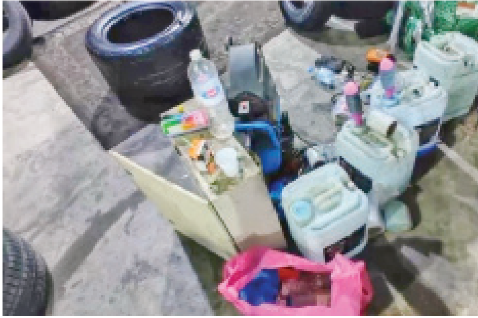
• من معدات التلاعب بصلاحية الإطارات

جديدة، بعد التلاعب في تاريخ صلاحيتها باستخدام مواد مخصصة لذلك، في صورة تهدد من صور الغش التجاري وتضليل المستهلكين، فضلا عما تشكله هذه الممارسات من خطر مباشر على سلامة مرتادي الطريق، نتيجة ضعف كفاءة الإطارات وعدم ملاءمتها لظروف القيادة، مما يزيد من احتمالية وقوع الحوادث المرورية ويعرض الأرواح والممتلكات للخطر. وتم تحرير محضر ضبط تحت مسمى «جباة أو بيع إطارات مستعملة»، وفقا للقانون بكل حزم».