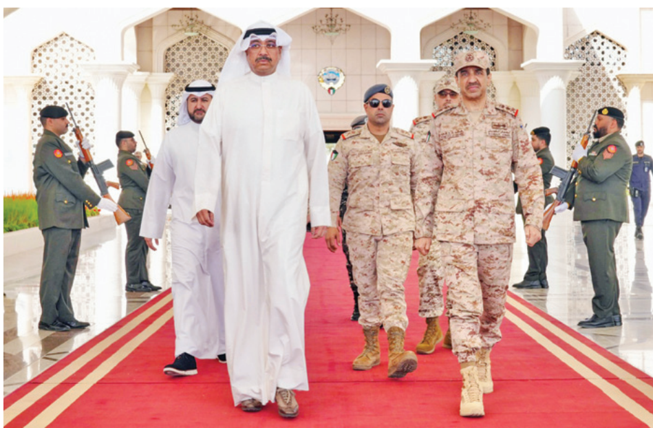
• وزير الدفاع الشيخ عبدالله العلي متوجهاً إلى تركيا في زيارة رسمية

والحرس الوطني. وكان في وداع الوزير لدى مغادرته البلاد رئيس الأركان العامة للجيش الفريق الركن خالد الشنيان ووكيل وزارة الدفاع الشيخ الدكتور عبدالله مشعل الصباح.