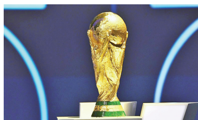
• كأس العالم 2030

التي تواصلت المشاورات خلال الفترة المقبلة بشأن شكل وعدد المنتخبات المشاركة في البطولة.