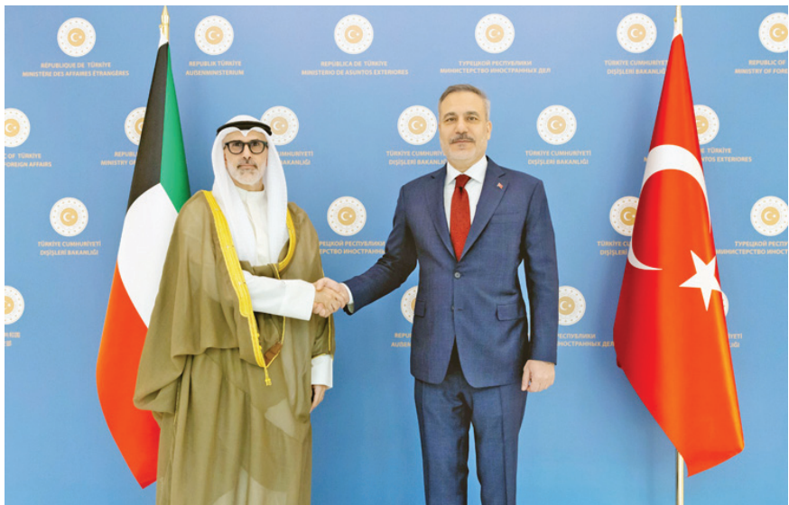
• وزير الخارجية أثناء لقائه نظيره التركي

أطر التعاون واستمرار التنسيق والتشاور بينهما في مختلف المجالات وعلى جميع المستويات بما يسهم في الارتقاء بها إلى آفاق أرحب. وأضافت أنه جرى خلال اللقاء بحث تطورات الأوضاع في المنطقة والجهود الدبلوماسية المبذولة حيالها حيث أكد الجانبان أهمية أن تفضي هذه الجهود إلى تسوية شاملة ومستدامة على نحو يعزز الأمن والاستقرار في المنطقة.