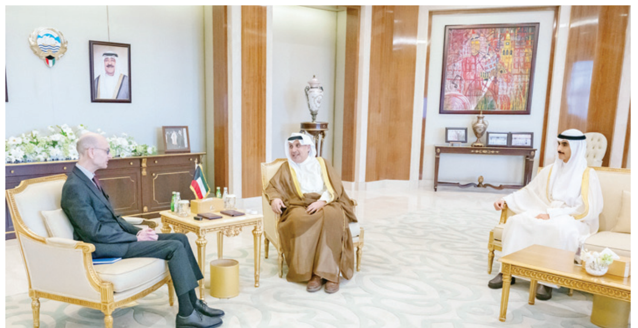
• الشيخ حمد جابر العلي والشيخ ناصر جابر الأحمد يستقبلان السفير د. جورج سعيد زاميت سفير جمهورية مالطا لدى البلاد

الروابط التاريخية التي تجمع دولة الكويت وماليزيا الصديقة وسبل الارتقاء بها في مختلف المجالات والتأكيد على الحرص المتبادل على مواصلة التعاون القائم وتطوره بما يعكس متانة العلاقات بين البلدين الصديقين.