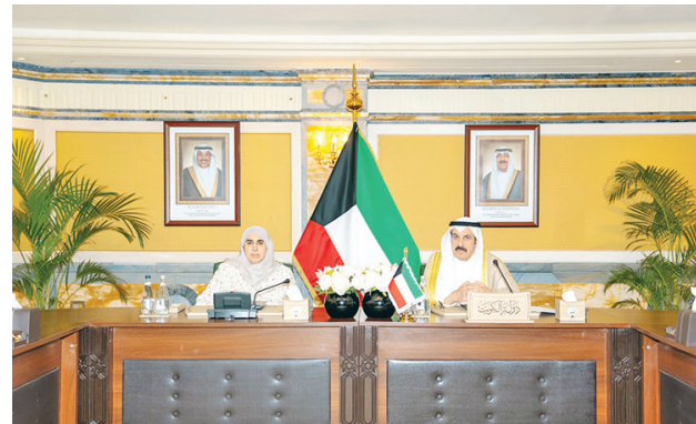
• وزير المالية د. يعقوب الرفاعي ووكيلة وزارة المالية أسيل المنيفي خلال مشاركتهما في الاجتماع عبر تقنية الاتصال المرئي

العربية إلى مواصلة تعزيز هذا الدور كشررك استراتيجي في مواجهة التحديات الاقتصادية ودعم مسارات التنمية المستدامة. وقد أسفرت الاجتماعات عن اعتماد عدد من القرارات، من أبرزها اعتماد تقارير مجالس الإدارة السنوية لعام 2025، وإقرار الحسابات الختامية للسنة المالية المنتهية في 31 ديسمبر 2025، اختيار رؤساء مجالس الإدارة ونوابهم من المحافظين، وتعيين المدققين الخارجيين لعام 2026. كما تمت الموافقة بالإجماع على مقترح الكويت باستقطاع 10% من صافي أرباح عام 2025 لدعم الشعب الفلسطيني، بما في ذلك دعم صندوق الأقصى ولجنة القدس الشريف، والموافقة على مقترح تعديل اتفاقية