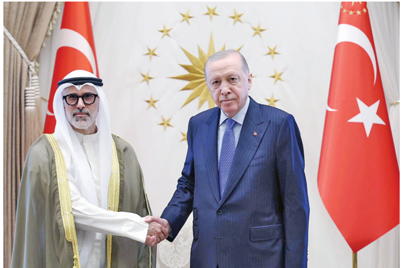
• وزير الخارجية لك لقاؤه الرئيس التركي

التقى وزير الخارجية الشيخ جراح جابر الأحمد أمس مع وزير خارجية الجمهورية التركية الصديقة هاكان فيدان خلال الزيارة الرسمية التي قام بها إلى العاصمة التركية أنقرة. وذكرت «الخارجية» الكويتية في بيان لها أنه تم خلال اللقاء استعراض العلاقات الثنائية الوثيقة بين البلدين والشعبين الصديقين والتأكيد على أهمية مواصلة تعزيز