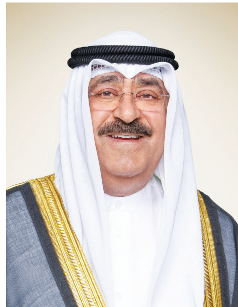
صاحب السمو أمير البلاد الشيخ مشعل الأحمد