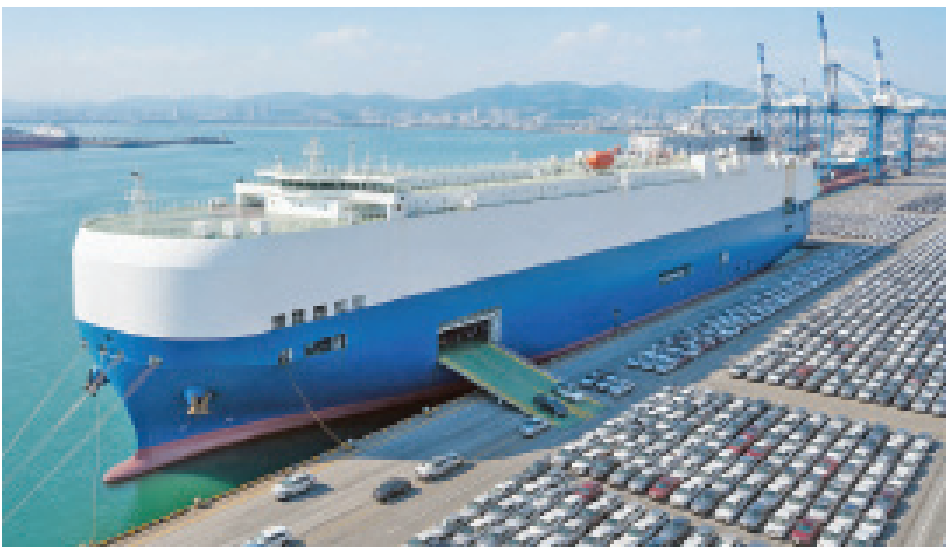
• السفينة الصينية العملاقة المتخصصة في نقل السيارات بما يضمن قنوات تصدير أكثر استقرارا

تتجه الصين إلى تعزيز بنيتها اللوجستية البحرية عبر تسريع بناء سفن عملاقة ومتخصصة في نقل السيارات، بما يضمن قنوات تصدير أكثر استقرارا وكفاءة إلى الأسواق العالمية، وذلك مع الارتفاع اللافت في صادرات السيارات الصينية خلال السنوات الأخيرة، ولا سيما مركبات الطاقة الجديدة. وأظهرت بيانات رسمية أصدرتها الهيئة العامة للجمارك الصينية ارتفاع قيمة صادرات المركبات في الربع الأول من العام الجاري بنسبة 54.2 في المئة على أساس سنوي، فيما قفزت صادرات المركبات الكهربائية بنسبة 77.5 في المئة.