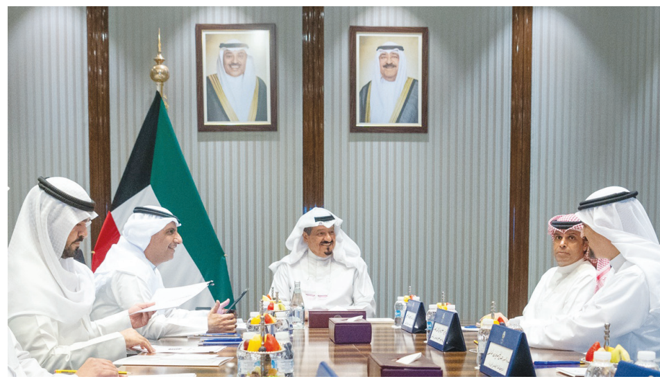
سمو الشيخ أحمد العبدالله رئيس الوزراء مترئسا الاجتماع

أعلن وزير العدل ورئيس لجنة الشؤون القانونية في مجلس الوزراء المستشار ناصر السميطة عن موافقة اللجنة بالإجماع على البرنامج الحكومي لحماية الأسرة وقررت رفعه إلى مجلس الوزراء باعتباره أول برنامج حكومي متكامل بهذا النطاق لحماية الأسرة في دولة الكويت. وقال المستشار السميطة إن البرنامج الحكومي لحماية الأسرة يهدف إلى تعزيز وعناية أكثر فاعلية في حماية الأسرة والطفل ودعم الاستقرار الاجتماعي وتعزيز التسوق المؤسسي بين الجهات الحكومية ذات الصلة. وأكد أن موافقة اللجنة تمثل خطوة مهمة للانتقال من المعالجات الجزئية لقضايا الأسرة إلى بناء منظومة حكومية شاملة تقوم على الوقاية والحماية والتأهيل وتجمع بين التطوير التشريعي والتحول الرقمي والتوعية المجتمعية ورفع كفاءة الجهات المعنية بالتعامل مع قضايا