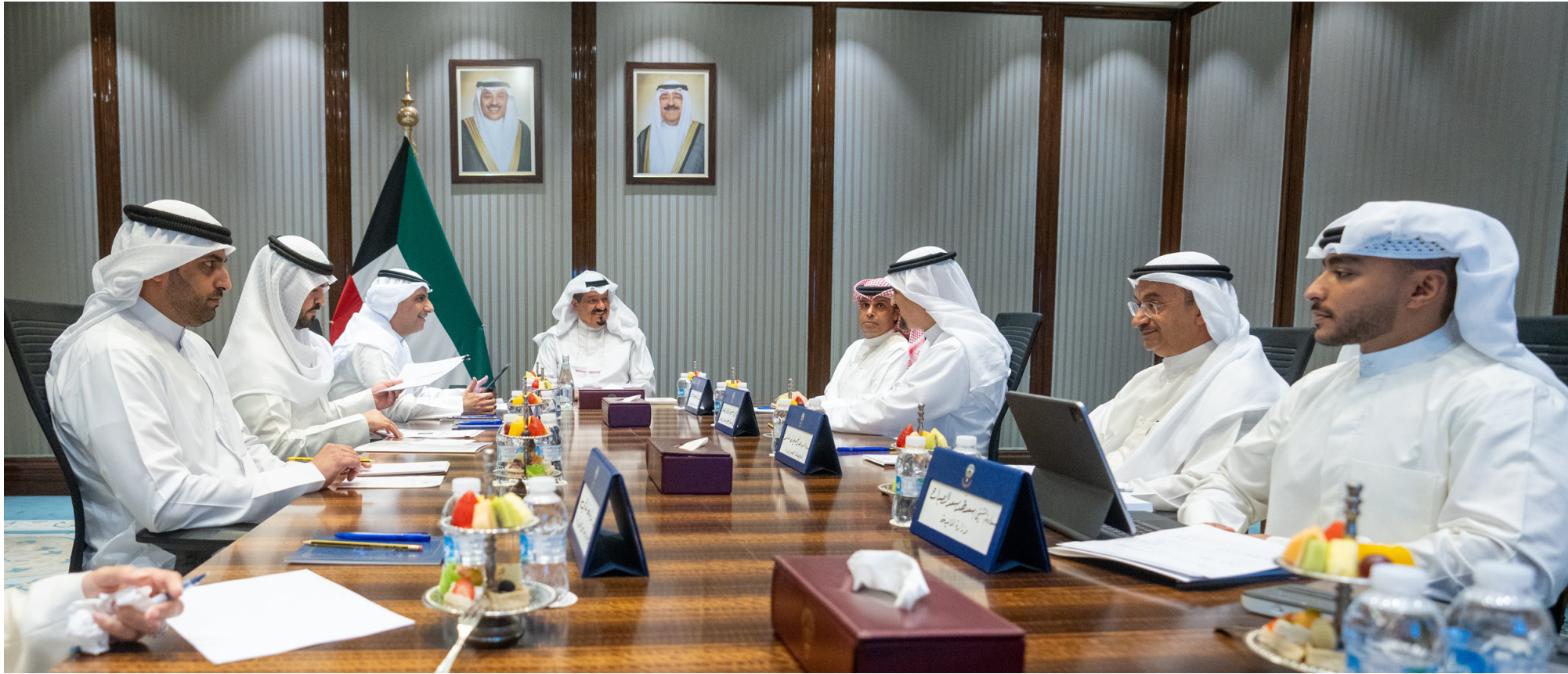
• سمو الشيخ أحمد العبدالله رئيس مجلس الوزراء ترأس اجتماعاً لبحث ومتابعة إعادة هيكلة الأجهزة الحكومية والمؤسسات العامة

ترأس سمو الشيخ أحمد العبدالله رئيس مجلس الوزراء اجتماعاً لبحث ومتابعة إعادة هيكلة الأجهزة الحكومية والمؤسسات العامة في الدولة. ووجه سمو رئيس مجلس الوزراء بمراجعة الهياكل الحكومية وإعادة تنظيمها بما يسهم في استثمار موارد الدولة ويضمن بناء منظومة إدارية متطورة تتسم بالكفاءة والشفافية والقدرة على مواكبة المتغيرات المستقبلية. حضر الاجتماع وزير الدولة للشؤون الاقتصادية والاستثمار عبدالعزيز المرزوق والمستشار بديوان رئيس مجلس الوزراء الدكتور خالد الفاضل ومدير عام هيئة تشجيع الاستثمار المباشر الشيخ د. مشعل جابر الأحمد ورئيس ديوان رئيس مجلس الوزراء بالإتابة الشيخ خالد محمد الخالد والأمين العام لمجلس الوزراء صالح الملا.